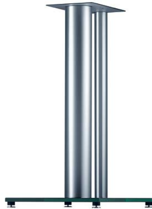
Beispiel Liedtke (klanglich am besten)